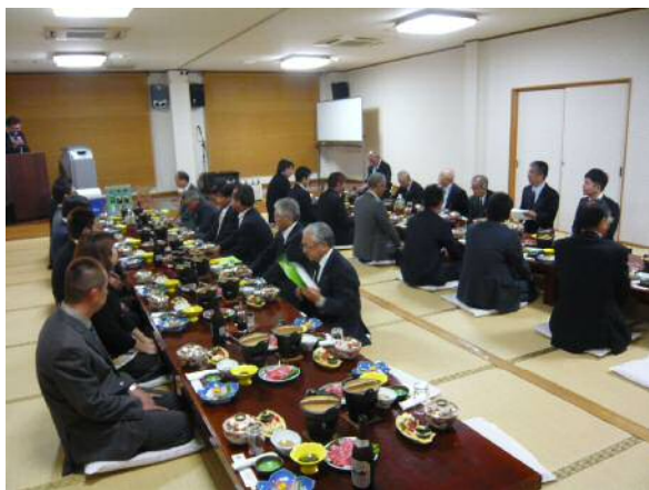
(部員総会後の来賓の方を交えた、交流会)