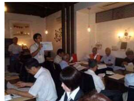
（那珂地区：ビストロまるまさ）

※今年も懇談会に先立ち国の補助を受けて行う伴走型経営発達支援事業のセミナーを実施