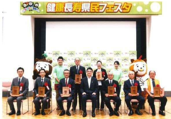
平成28年度 健康長寿推進企業等知事表彰 平成28年9月19日

これまで佐土原町商工会で20年以上取り組んできました「会員健康診断」をはじめとして各種福祉厚生活動が評価され9月19日（月）に開催された「健康長寿県民フェスタ」において、知事表彰最優秀賞を受賞いたしました。