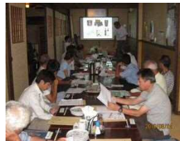
（佐土原地区：かぼちゃ）