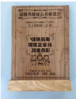
県産材を使った表彰盾