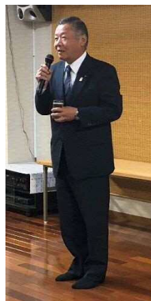
横田県議会議員の挨拶